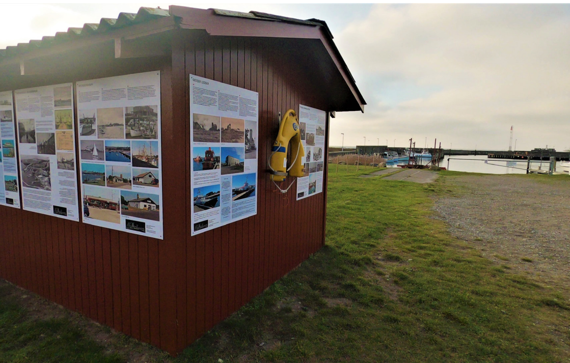
Bedingshuset ved fiskerihavnen med formidling, et af Gedser Bylaugs projekter.