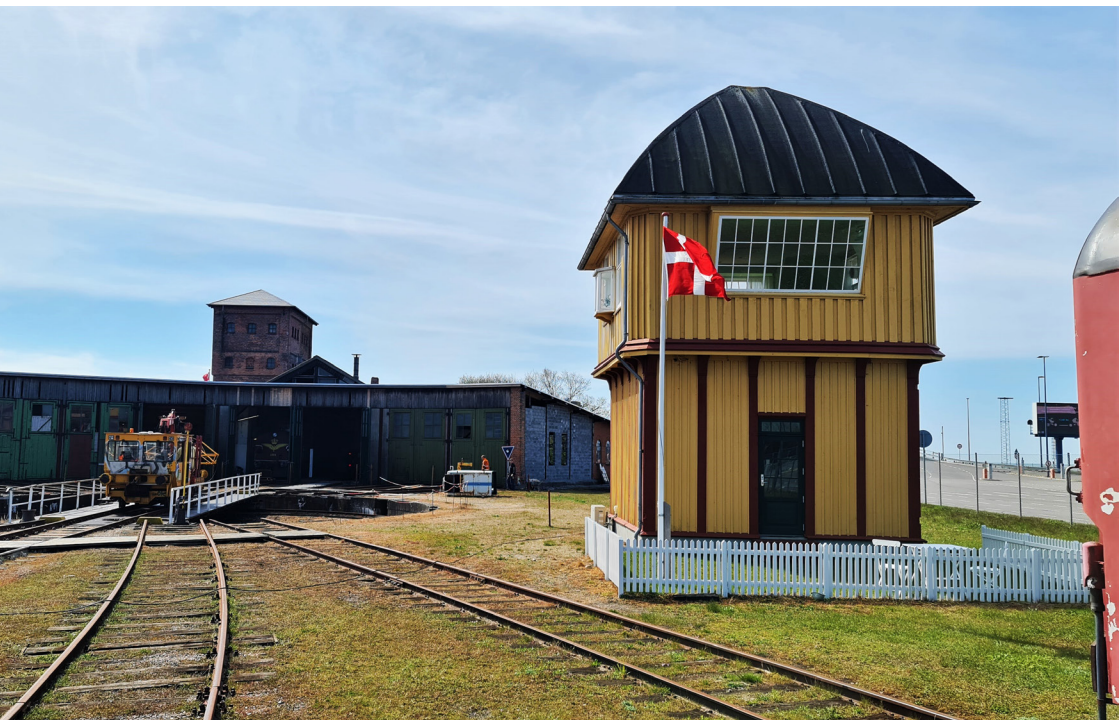
Foto: Det Gule Palæ, indeholder en spændende udstilling.