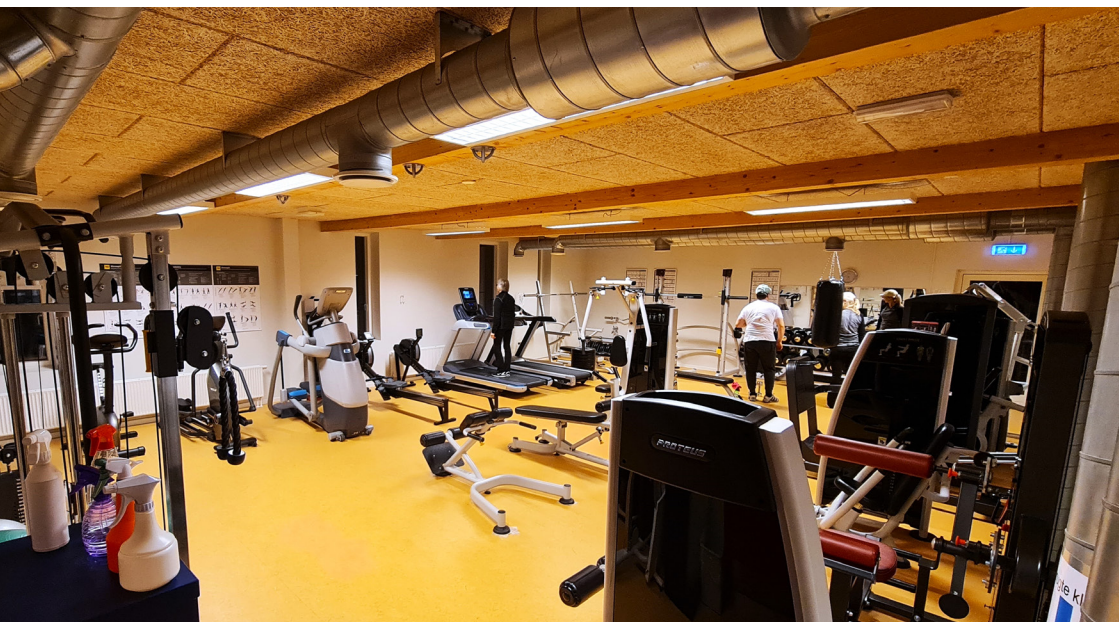
Foto: Fitnesslokalet i GIM.