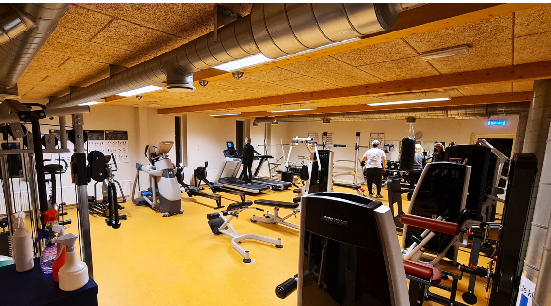
Foto: Fitnesslokalet i GIM.