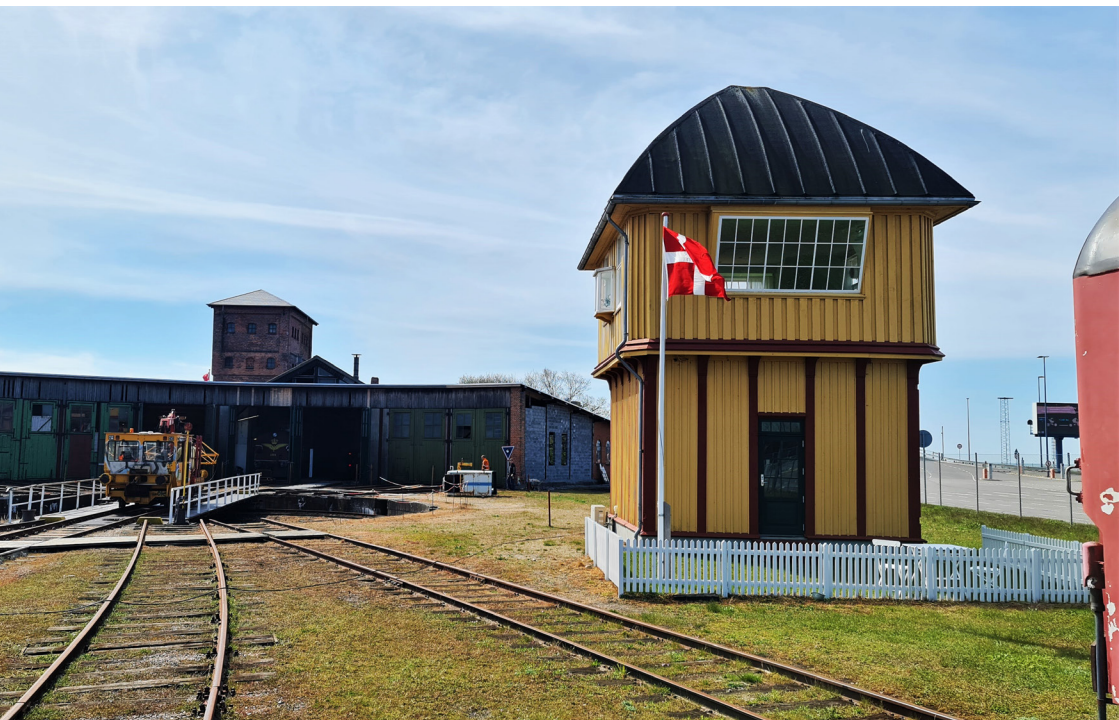
Foto: Det Gule Palæ, indeholder en spændende udstilling.