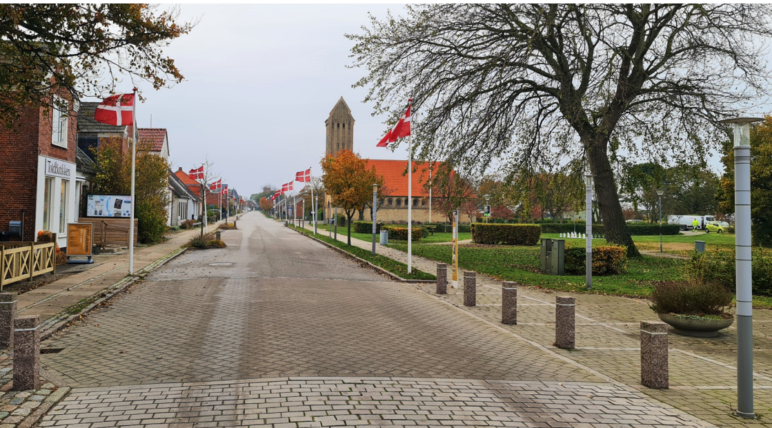
Foto: Hver sommer arrangerer grundejerforeningen den flotte flagallé gennem hele Gedser.

Gedser Grundejerforening, Skovgårdsstien 2, 4874 Gedser. Kontakt til Gedser Grundejerforening på tlf: 5150 0550 Besøg Gedser Grundejerforeningen på www.gedsergrundejerforening.dk