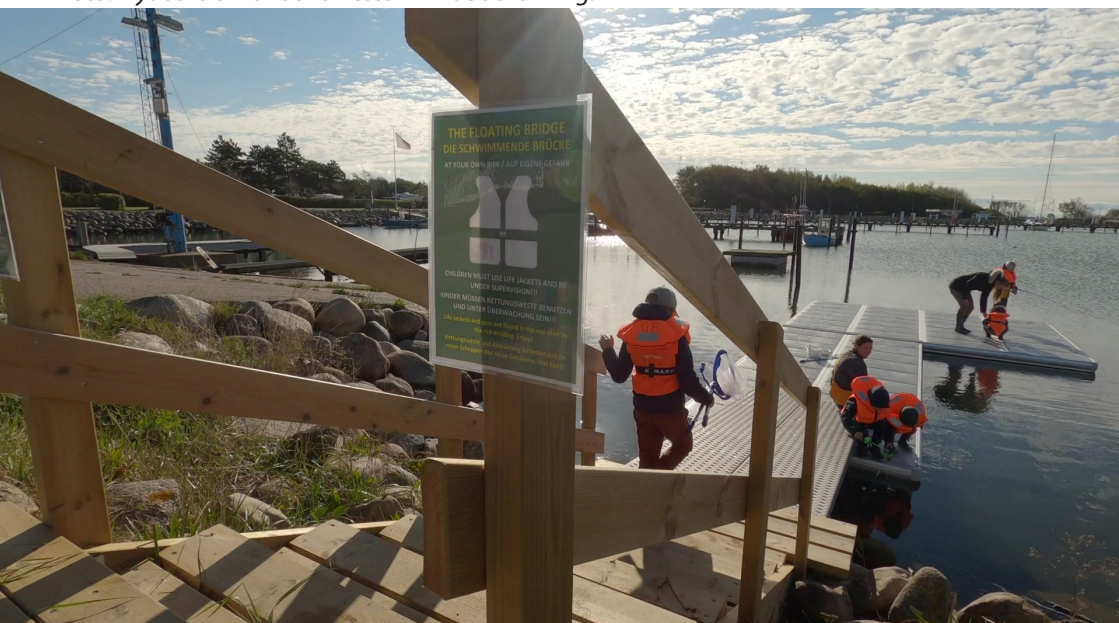
Flydebro til vandaktiviteter fx krabbefiskning.

På de næste sider finder I en beskrivelse af nogle af områdets foreninger og hvem I kan kontakte for flere oplysninger.