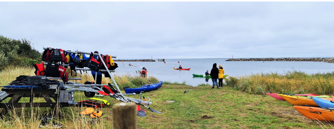
Foto: øverst, fra "Besøg Gedser Havkajak" dagen. Nederst, første instruktion og træning.

Her kommer opslag når vi nærmer os opstart.