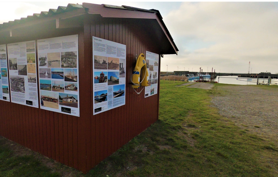
Foto: Bedingshuset ved fiskerihavnen med formidling, et af Gedser Bylaugs projekter.